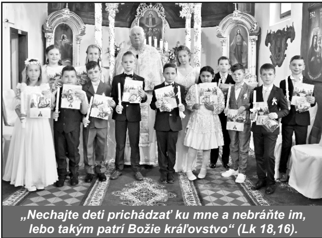
„Nechajte deti prichádzať ku mne a nebráňte im, lebo takým patrí Božie kráľovstvo“ (Lk 18,16).

V duchu týchto slov sa aj v našej farnosti dňa 19. a 20. júna 2021 uskutočnilo slávnostné prijatie sviatostí Zmierenia a Eucharistie. K sviatostiam pristúpilo 13 detí.